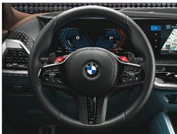
M 多功能真皮方向盤搭配專屬縫線(含碳纖維換檔撥片)