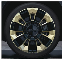
M 星輻式 923M