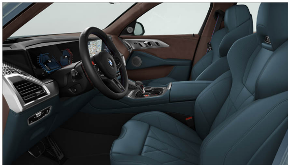
BMW Individual Merino 真皮 / M 雙前座跑車座椅搭配專屬發光字樣